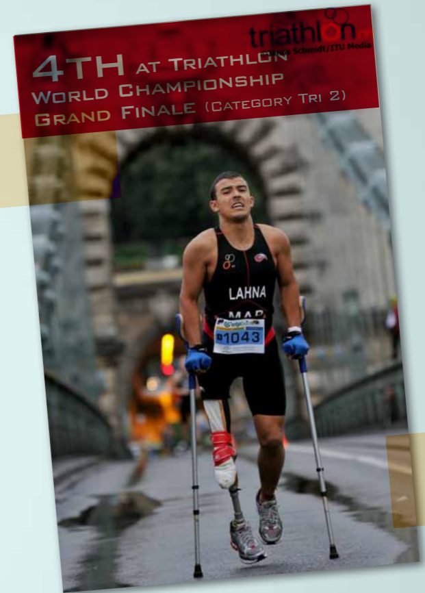
4TH AT TRIATHLON WORLD CHAMPIONSHIP GRAND FINALE (CATEGORY TRI 2)

October 25, 2009 San Diego Challenge, USA. Half-Ironman with challenged athlete category (1.9 km swim / 90 km bike/ 21 km racing chair) in 5h23. > 8th place finish